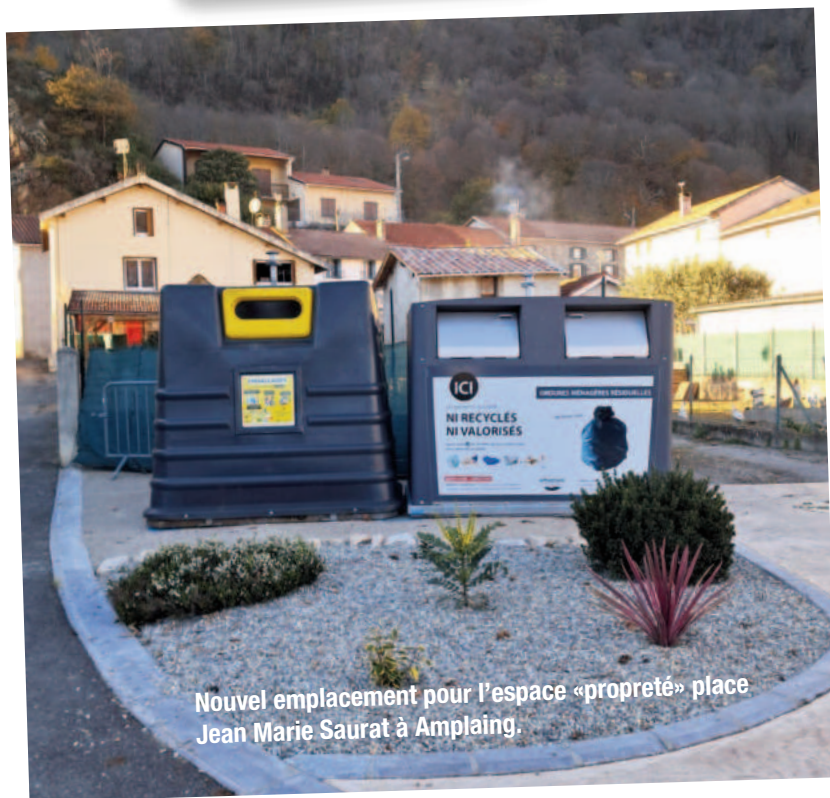
Nouvel emplacement pour l'espace «propreté» place Jean Marie Saurat à Amplaining.