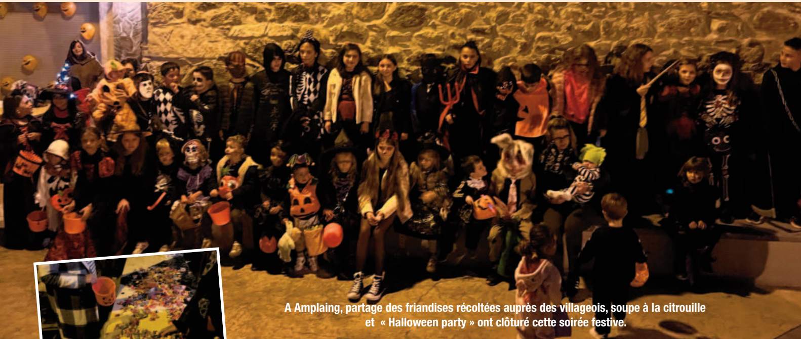
A Amplaing, partage des friandises récoltées auprès des villageois, soupe à la citrouille et « Halloween party » ont clôturé cette soirée festive.

Merci aux enfants et aux organisateurs pour cette soirée d'épouvante. Ils perpétuent les traditions.