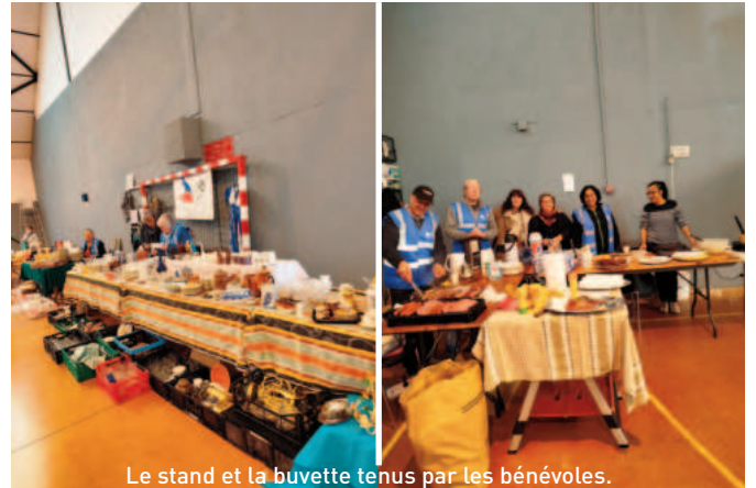
Le stand et la buvette tenus par les bénévoles.

Le Secours Populaire voué à la cause humanitaire a organisé un vide grenier, le 17 novembre dernier. Installés dans la salle polyvalente, la cinquantaine d'exposants proposaient aux visiteurs, quantité d'objets hétéroclite à des prix défiant toute concurrence.