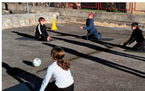
Les élèves d'Amplaing

Nous organisons au sein de la classe un concours de construction de tours, rien qu'avec du matériel de numération. Les premiers participants se montrent déjà très créatifs ! Le gagnant, désigné par vote, remportera un diplôme d'architecte. Le but est de construire la tour la plus belle, la plus impressionnante ou originale... mais attention, c'est avant tout de participer!